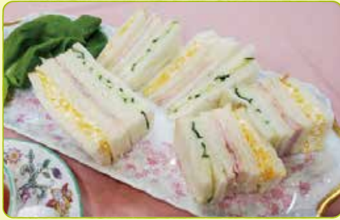
※写真は盛り付け例