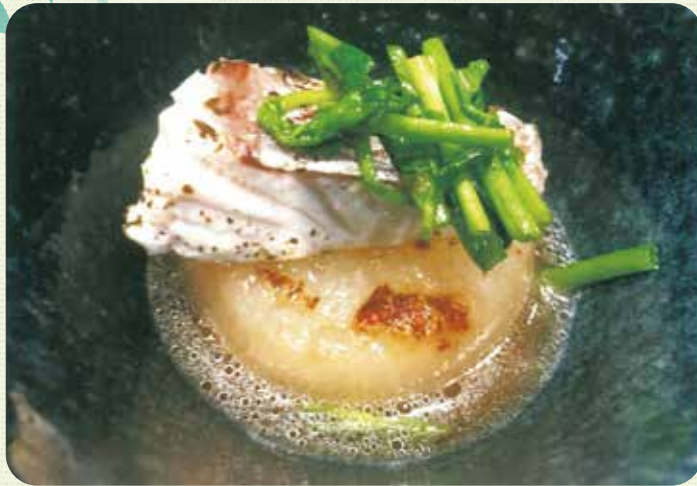
焼きダイコン タイのスープで