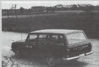
普及推進のため農村に行くクミアイ家庭薬車