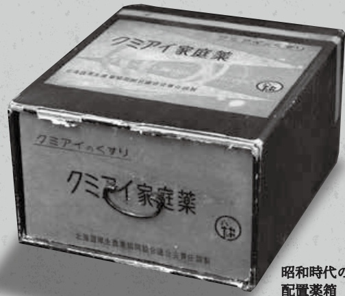
昭和時代の 配置薬箱