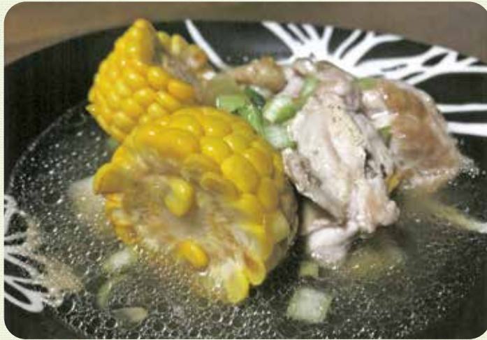
トウモロコシと 鶏も肉のスープ