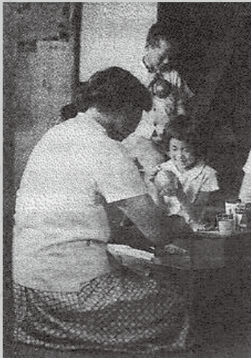
家庭薬を配置している風景

日本の家庭薬と共に歩んできた「JA配置薬」は、これからも健康で豊かな暮らしを応援していきます。