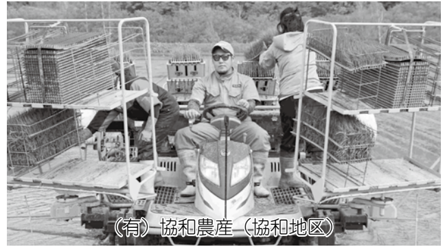
（有）協和農産（協和地区）