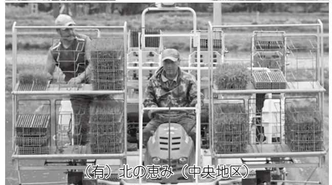
（有）北の恵み（中央地区）