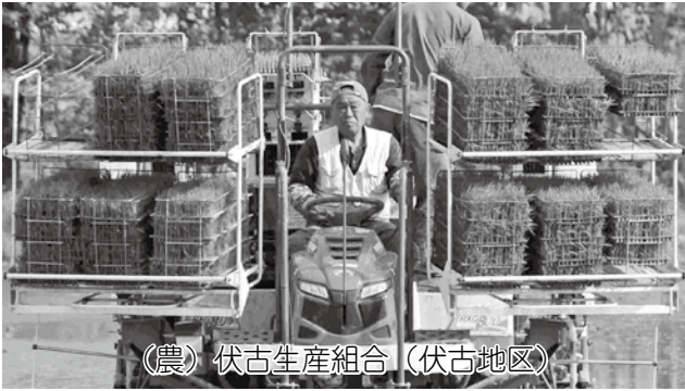
（農）伏古生産組合（伏古地区）