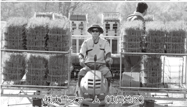
（株）大雪ファーム（東雲地区）