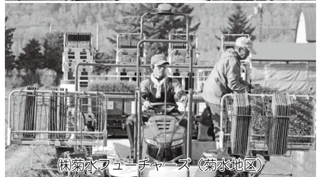
（株）菊水フューチャーズ（菊水地区）