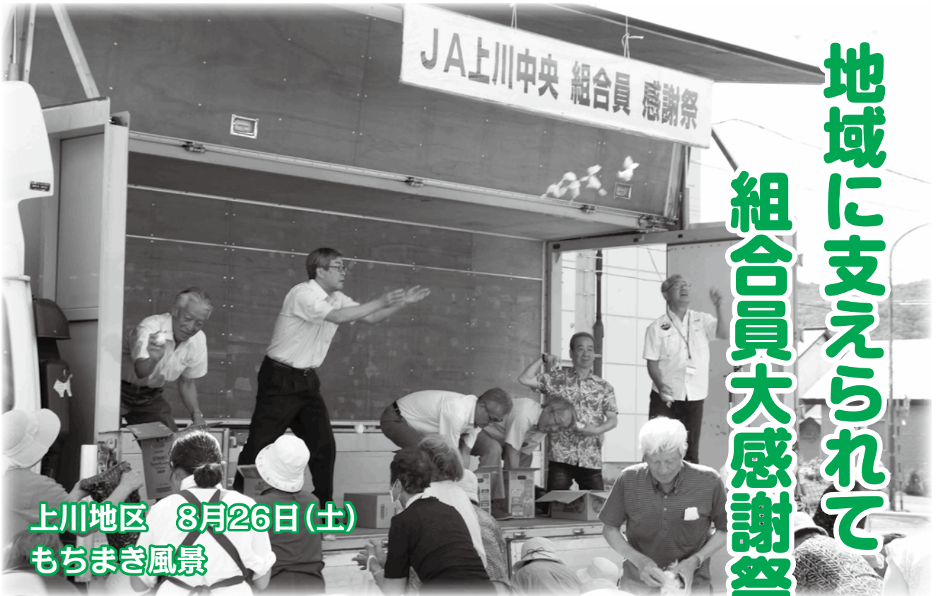
上川地区 8月26日(土) もちまき風景