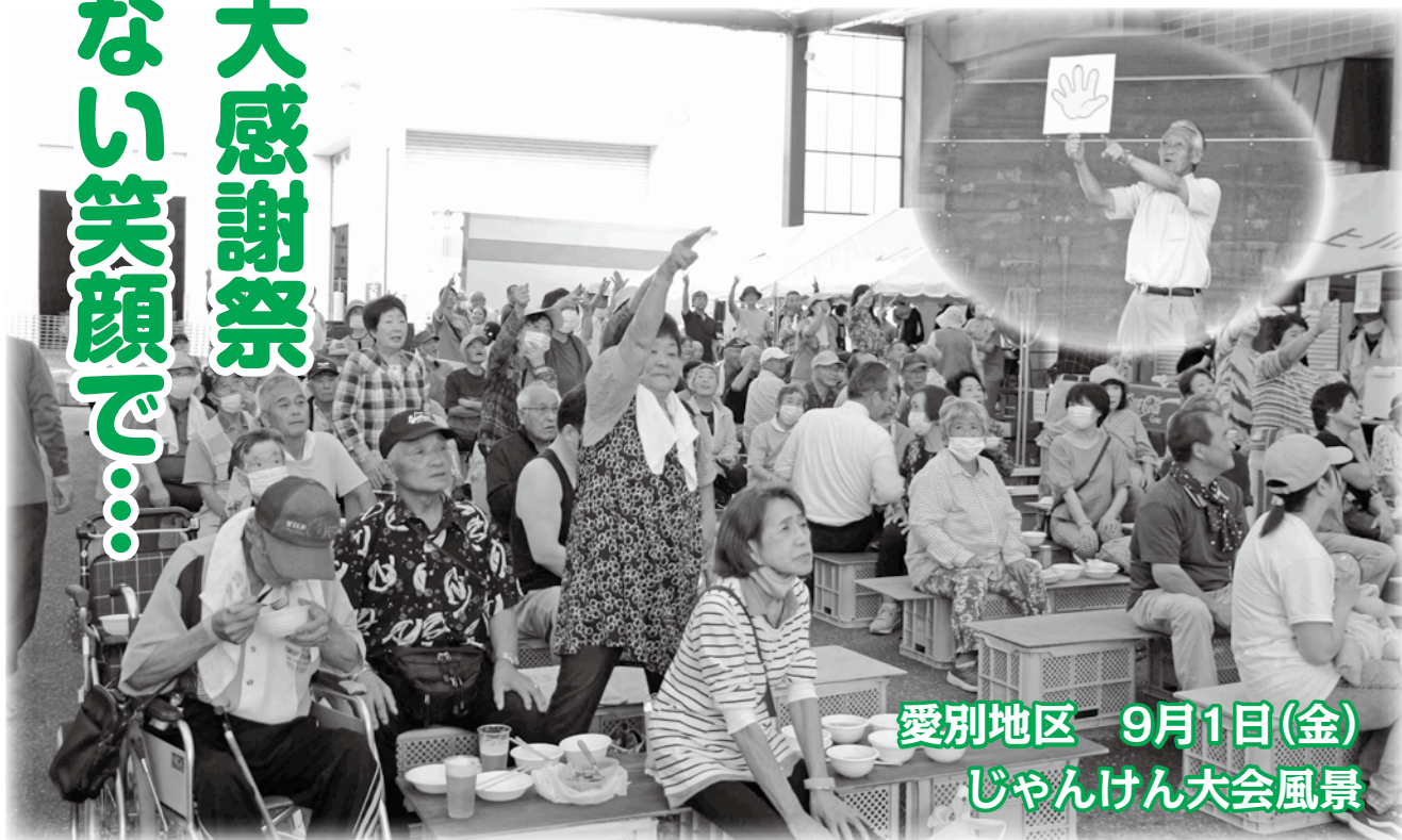
愛別地区 9月1日(金) じゃんけん大会風景

愛別地区の第12回組合員感謝祭を、色彩選別特設会場で盛大に行いました。参加した組合員は約150名で、じゃんけん大会、愛別中吹奏楽のミニコンサート、ビンゴ抽選会などのイベントを行い、美味しい焼肉・手打ちそばなどのご馳走も用意され、組合員の皆様は雨にもかかわらず、楽しいひと時を過ごされました。