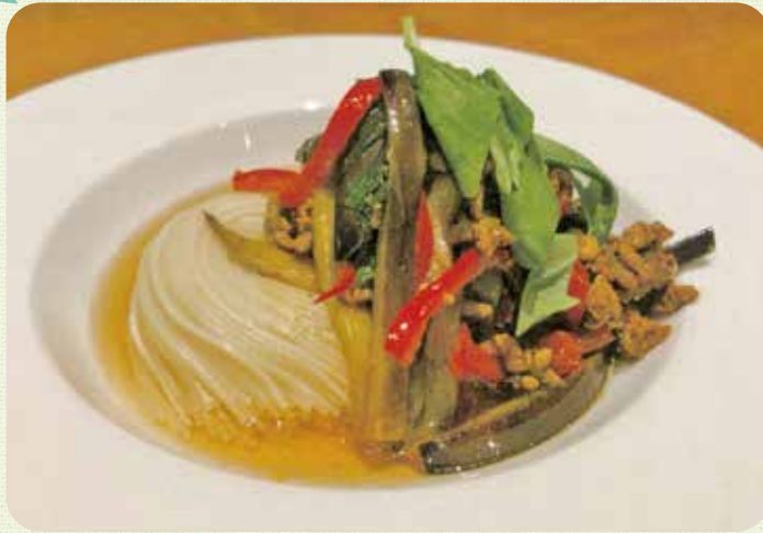
ガパオ風そうめん