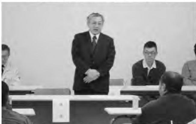
3月7日 上川町畑作園芸定期総会