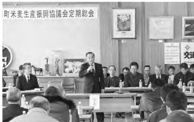
2月27日 愛別町米麦生産振興協議会定期総会