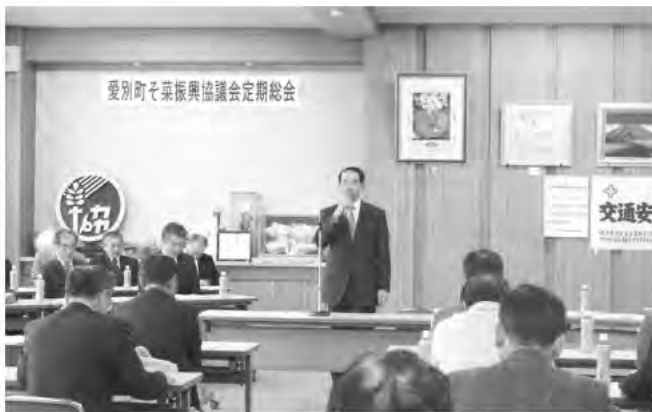
2月27日 愛別町そ菜振興協議会定期総会