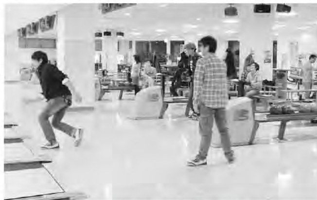
2月25日 愛別町青年会議冬季交流会