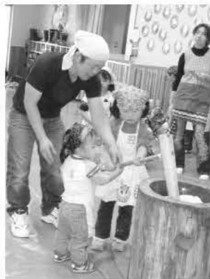
愛別幼児センター もちつき大会