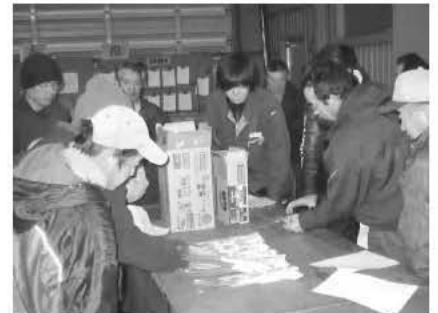
小ねぎ現地研修会