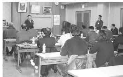
愛別町 七菜振興協議会研修会