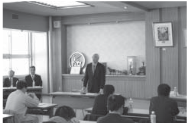
愛別町農業用機械利用組合連合会定期総会