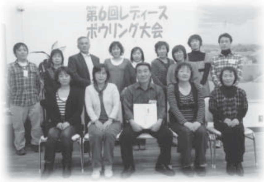
参加者全員で記念撮影