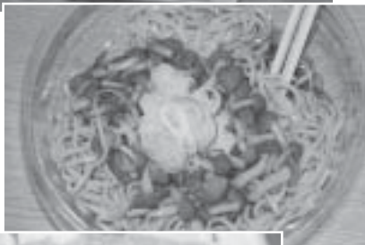
愛別産なめこを使用したそば