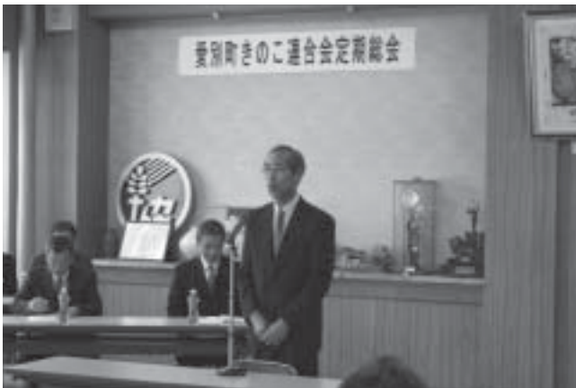
愛別町きのこ連合会定期総会