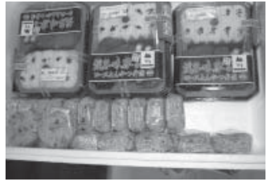
当日用意されたお弁当