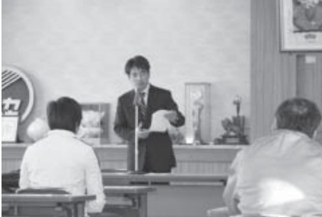
愛別町青色申告会定期総会