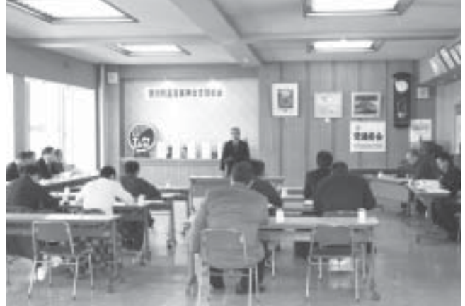
愛別町畜産振興会定期総会