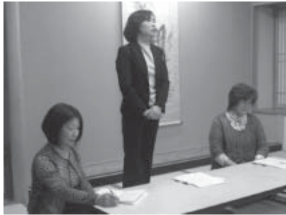
懇話会で店舗商品の説明等を行いました。